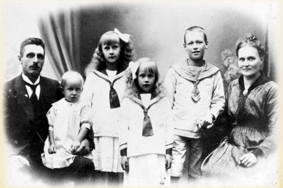
Астрид (третья слева) с родителями, братом и сестрами