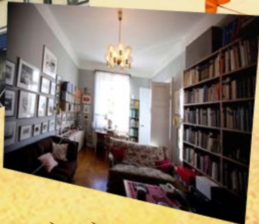
Квартира-музей Астрид Линдгрен в Стокгольме