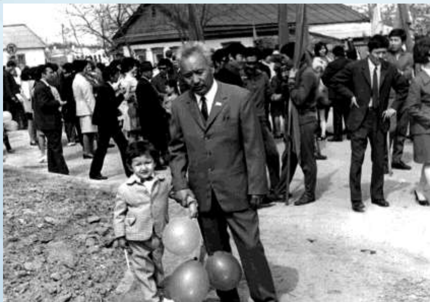
Со старшим внуком на первомайской демонстрации, 1971 г.