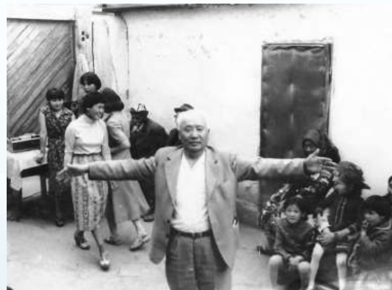
Июль, 1982 г.