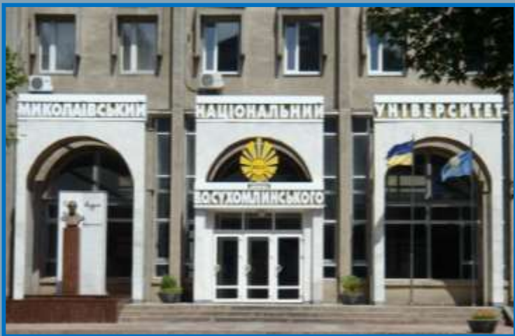
Николаевский национальный университет