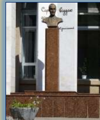
Перед зданием университета установлен бюст В. А. Сухомлинского.

Имя В. А. Сухомлинского присвоено Павлышской сельской средней школе. В ней же в 1975 году создан педагогический музей Сухомлинского, установлена мемориальная доска. В одной из аудиторий Полтавского педагогического института был открыт музей Сухомлинского, а у входа в здание установлена мемориальная доска. Его последователями были созданы Международная ассоциация В.А. Сухомлинского и Международное объединение исследователей Сухомлинского. Имя Героя в 2003 году присвоено Николаевскому национальному университету.