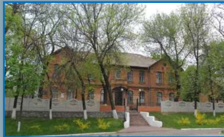
Историко-педагогический музей В. А. Сухомлинского в Павлышской средней школе