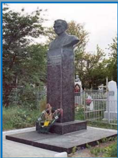
Памятник В. А. Сухомлинскому